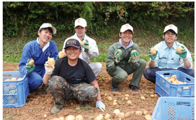
長島地区の小学生と一緒にバレイショ収穫