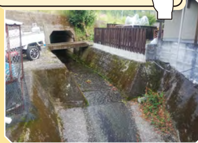
写真(3) 高知県四万十町