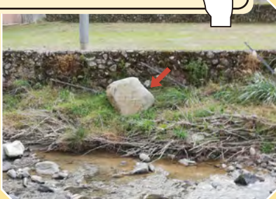
写真(1) 福岡県朝倉市