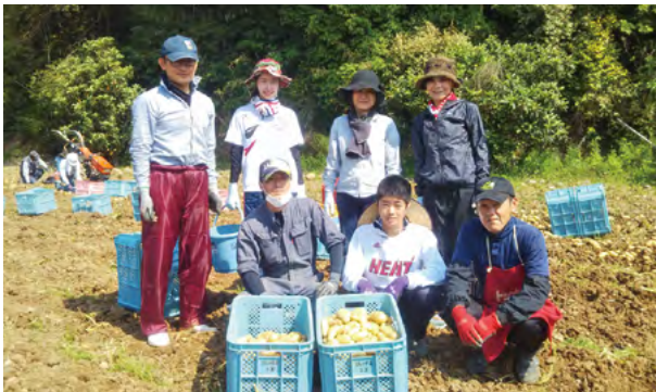
阿久根市のほ場で作業を行ったみなさん