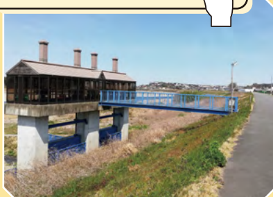
写真(2) 三重県伊勢市