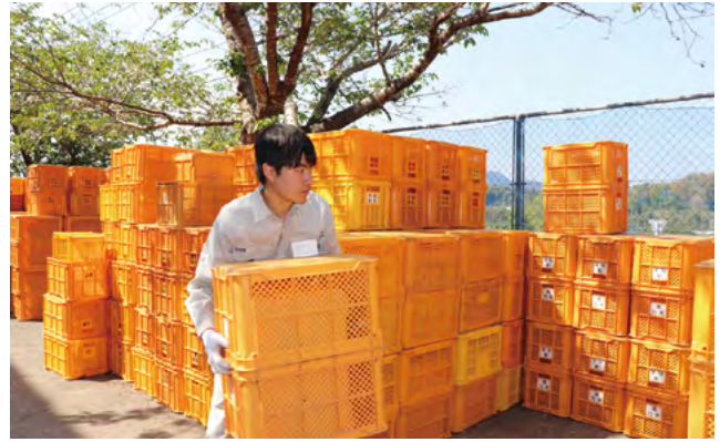
果実選果場で作業する新採用職員

農家体験をした県連新採用職員は「農家さんの声を直接聞くことができ良い経験になりました」「今までスーパーなどに並んでいるものしか見たことがなかったけど、今回の実習を通して農家さんの凄さと大変さを知ることができてよかったです」と話していました。受入先の農家の皆さんも「若い人達が手伝ってくれて本当に助かった」と喜んでいました。