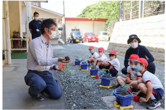
ミニトマト大きくなあれ!

国内では新型コロナウイルスの感染が拡大したことで、牛肉輸出や外食などの業務用需要は大幅に減少し、枝肉相場への影響も先行きが不透明な状況です。そのため、今後の牛肉の流通・消費拡大への取組み方針と各支部の部会活動活性化に向けた情報共有及び意見交換が行われました。今後も肥育牛部会では全体研修会や関係機関との連携により地域内肉用牛の振興を図っていきます。なお当日は全員がマスクを着用し規模を縮小して開催されました。