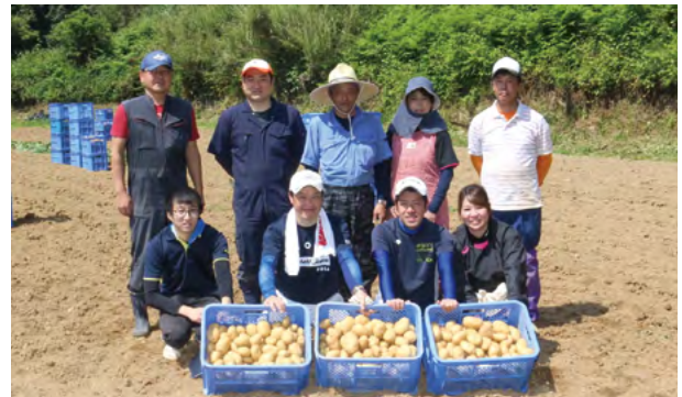
長島町のほ場で作業を行ったみなさん

JAは5月2日、生産現場での労働力確保対策として、阿久根市と長島町内のほ場でJA県連職員の有志とともにバレイショの掘り取りを行いました。