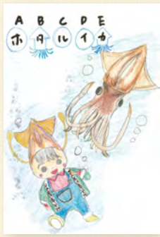
出水市高尾野町 P.N リンタロウの姉さん