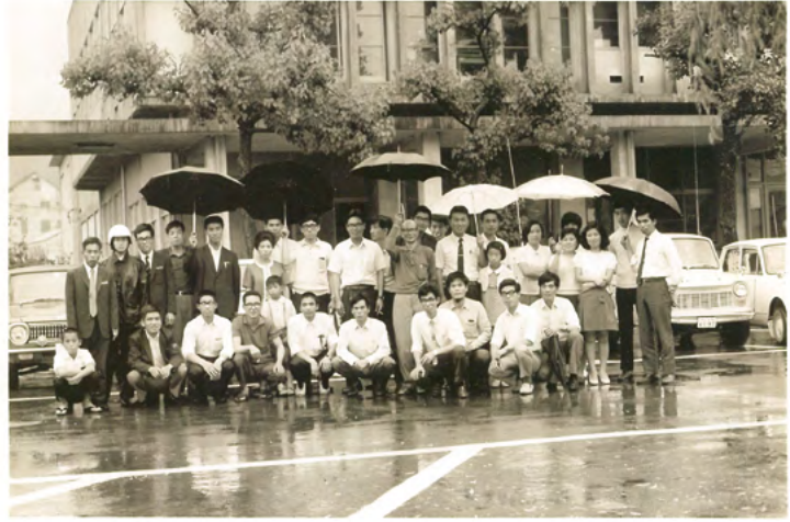
出水ハムクラブ結成（旧出水市役所前）