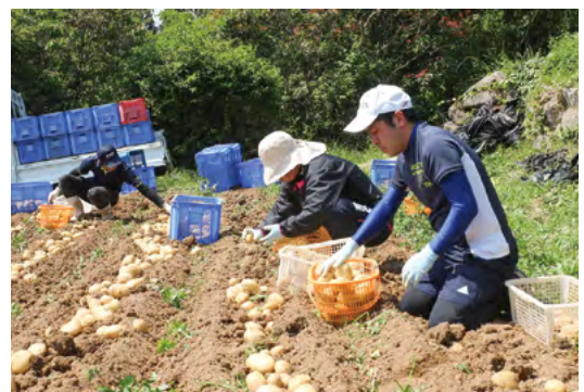
掘り取り作業を行う参加者

参加した県連職員は「はじめて体験する作業で、思っていたよりもきつい作業でしたが、農家の方のために少しは役に立てたのではないかと思います」と話していました。