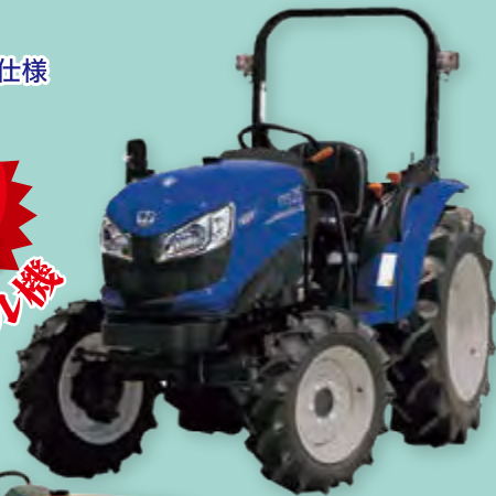
ISEKI RTS25VGQA15D 25馬力