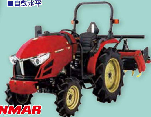
YANMAR YT225XUKS5 25馬力