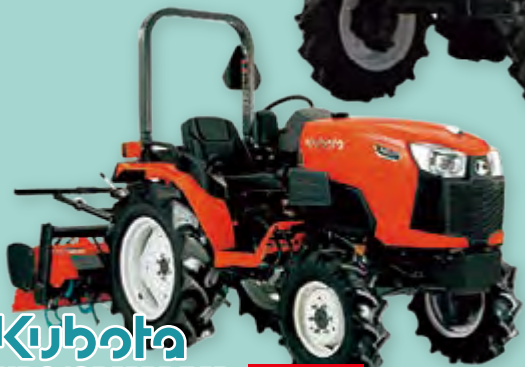
Kubota NB21SPMARF4B 21馬力