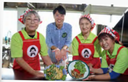
# ジャンボいんげんのカレーマヨサラダと豚肉ロール # 豆類部会女性部

いづらくん活動の舞台裏や地域みなさまとの交流などオフショット写真を公開していくよ！！