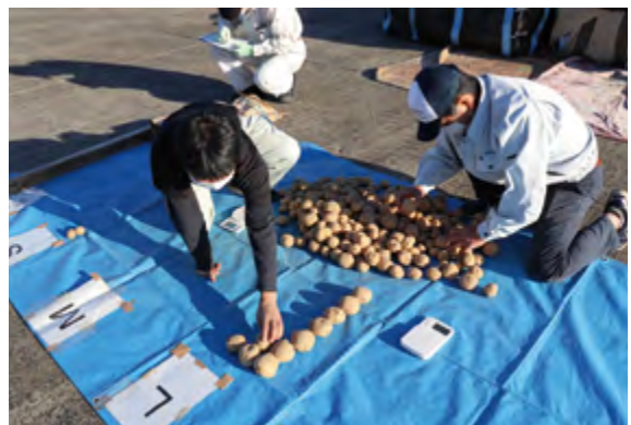
大きさや品質をチェックをするJ A担当職員ら