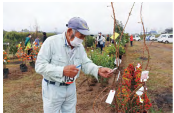
目当ての品を探す購買者