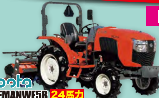
Kubota SL24FMANWF5B 24馬力