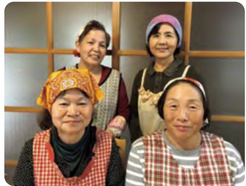
JA女性部 三笠支部のみなさん