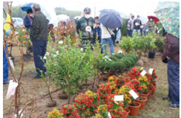
雨の中、多くの購買者が来場

なお、入場の際には、新型コロナウイルス感染防止対策として、マスク着用の呼び掛け、検温、消毒を行います。