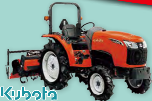
Kubota FT240BMAQF5SB 24馬力