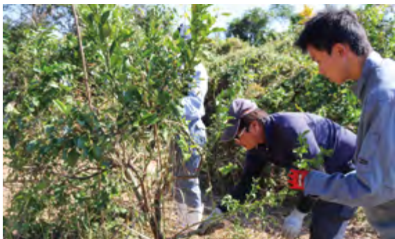
果樹園の整備をする生徒とJA職員

今後もJAでは、積極的に農業・職場体験の受け入れを行い、これからの地域農業を担う若い世代にも農業の魅力を伝えていきます。