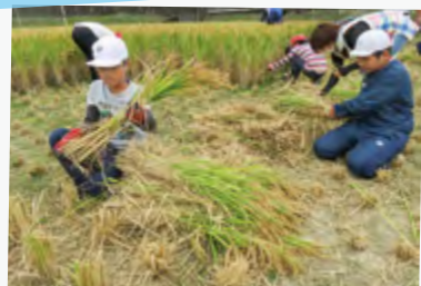
# 去年よりたくさんとれて嬉しいな^^♪ # 早く新米が食べたい！