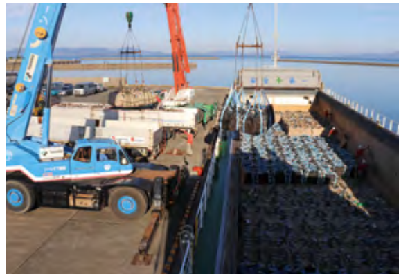
次々と荷揚げされる種子バレイショ

なお、荷揚げされた種子はチャーターしたトラックで長島地区へ搬送し、およそ800戸の生産者に配布。早場地区では11月下旬から春バレイショの植え付けが始まっています。