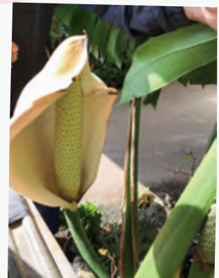
# 切通さん「70年生きてきて初めて見ました！」 # 花言葉は「嬉しい便り」など # いいことありそう♪