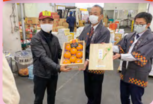
大将季1ケース (桐箱: 4L/8玉) 過去最高の値がつきました!!