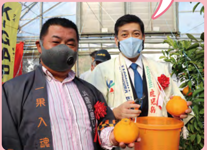
塩田康一県知事も一緒に銚入れ