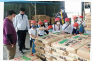
#資材センター「いづる館」 #資材や飼料がいっぱい！