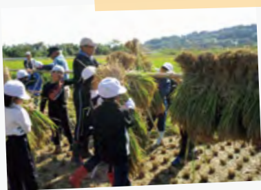
#上手に干せるかな