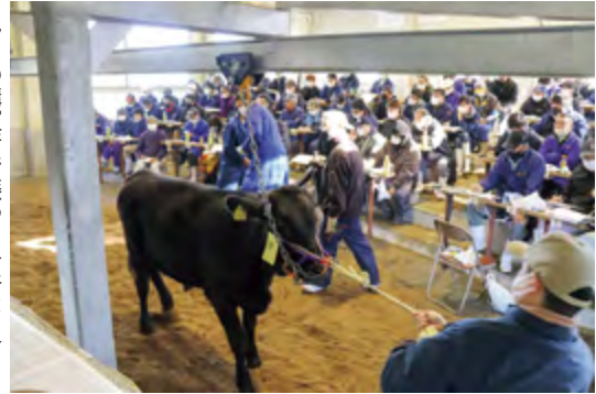
多くの購買者で賑わつ子牛セリ市

J A管内のいちご生産者は22人。12月上旬から出荷のピークを迎え、来年5月までに出荷数量は150トンを見込んでいます。