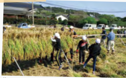
#みんなで頑張りました！ #新米たのしみだな

いづるくん活動の舞台裏や地域のみなさまとの交流などオフショット写真を公開していくよ！！