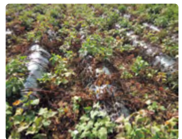
サツマイモ基腐病発生ほ場

採苗する際は、地際から5cm以上の位置で切ります。これは①苗への伝染のリスクを減らす、②わき芽を出して次の採苗に備えるためです。育苗床で発病した株は地上部の変色やしおれ症状が見られるため、症状を確認したら種いもごと抜き取り、ほ場外に持ち出し処分します。