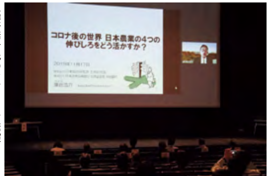
藻谷浩介氏のオンライン講演