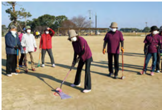
白熱したプレーを繰り広げる女性部員ら

今後もJ Aでは、継続的な粗飼料の確保や生産基盤の強化を図るとともに、感染症防止策等の衛生管理を徹底していきます。