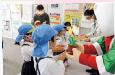
#園児達から、かわいいプレゼントをもらったよ♡