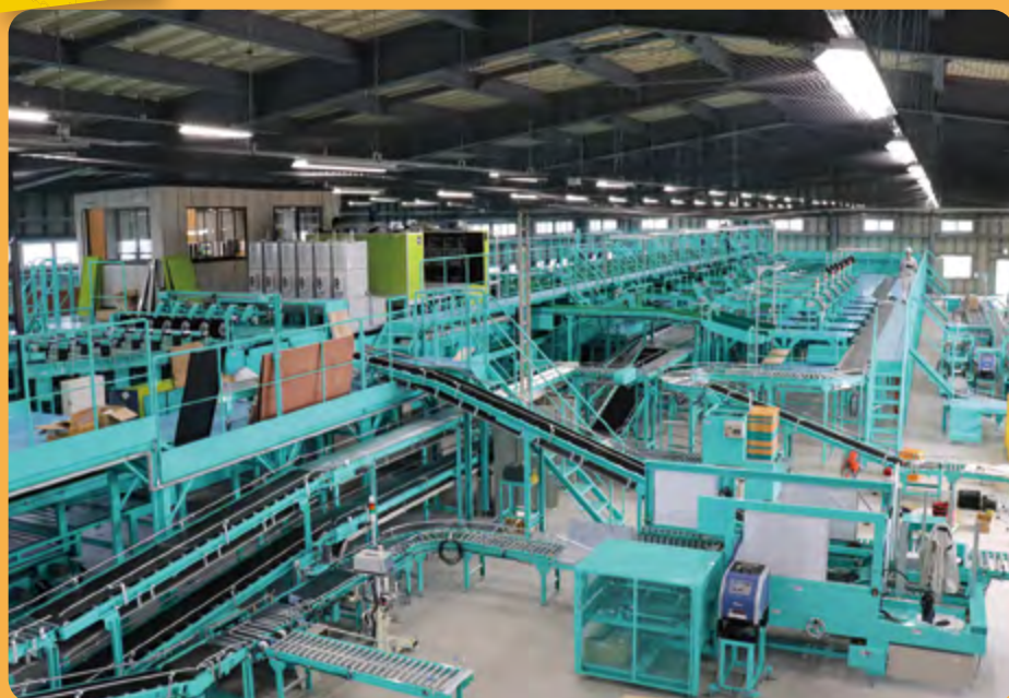
新たな機械の導入により選果能力が向上します！