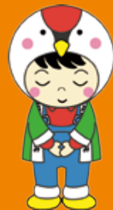
JA鹿児島いずみ 公式マスコットキャラクター いづくん