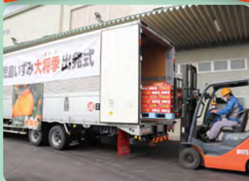
大将季、全国の消費者のもとへ!!