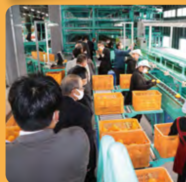
参加者らが、稼働状況を