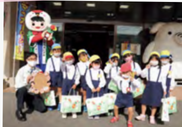
#いづるくん「毎年ありがとう！」