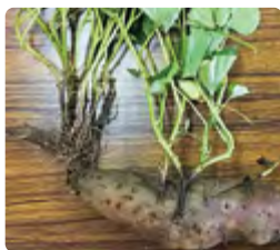
育苗ほ場の発病種イモ

土壌病害の防除対策として、育苗ハウスのビニール被覆後地温15℃を確保したら、適切な土壌水分(土を軽く握って団子にヒビが入る程度)でバスアミド微粒剤を全面散布後土壌混和します。ビニール等で15~20日間被覆後、ガス抜きを行います。基腐病、つる割病等が発生したほ場の種いものは、病原菌を保菌しているので、種いもには使えません。