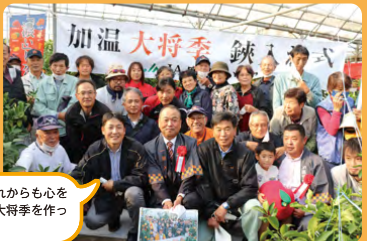
大将季生産者のみなさん