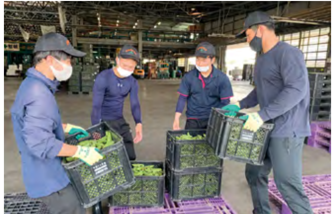
園芸流通センターでソラマメの荷受