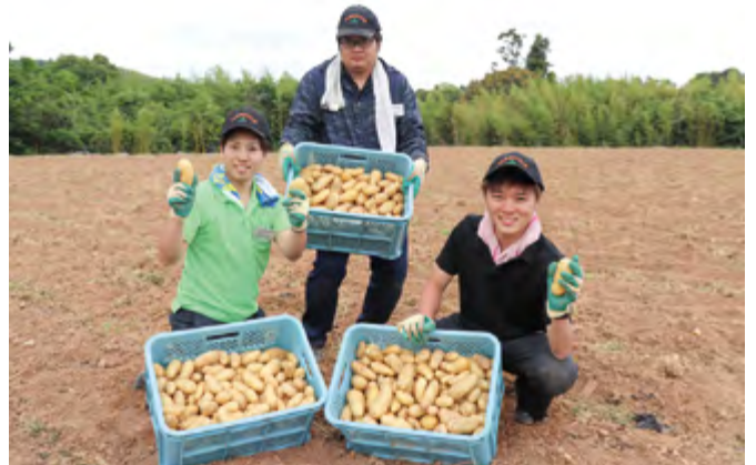
バレイショの収穫体験