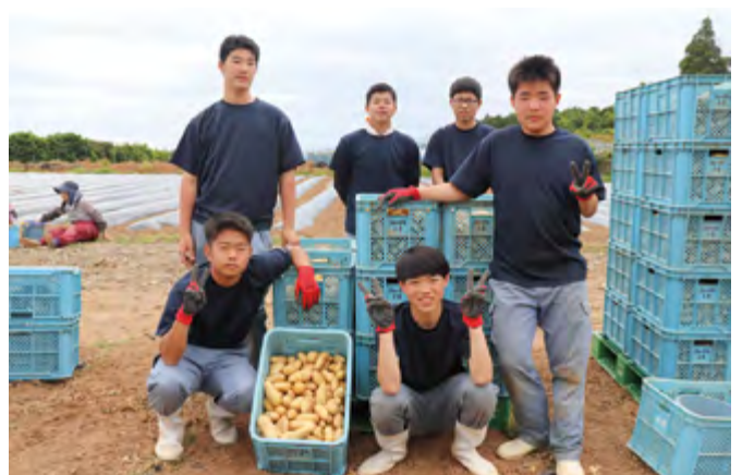
たくさん収穫できました