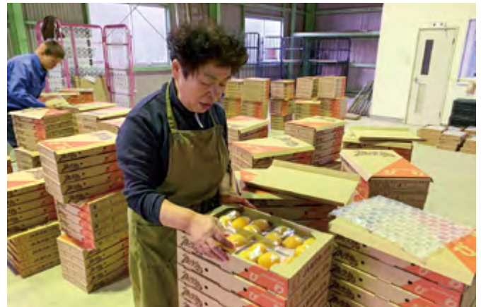
ピワの品質チェックをする生産者