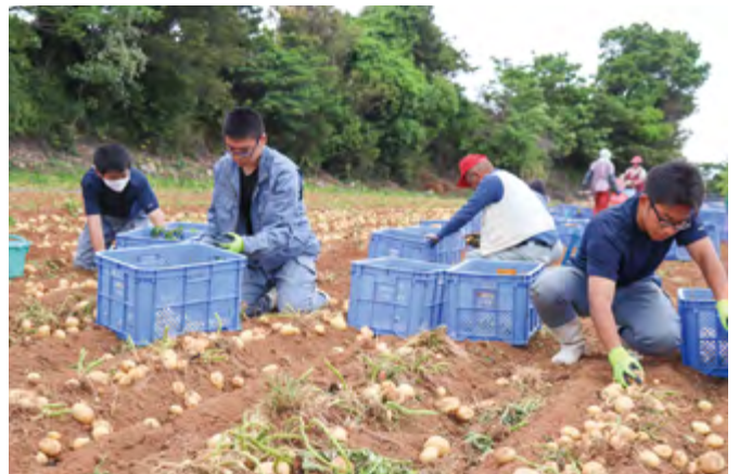
黙々と春バレイショを収穫する生徒ら

今後も、JAでは高校生による「援農」をはじめ、ベトナム人技能実習生による農作業の請負や農福連携などの取り組みをさらに強化し、農家への労働力支援に力を入れていく方針です。