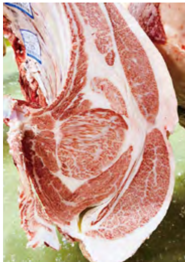
最優秀賞を獲得した枝肉