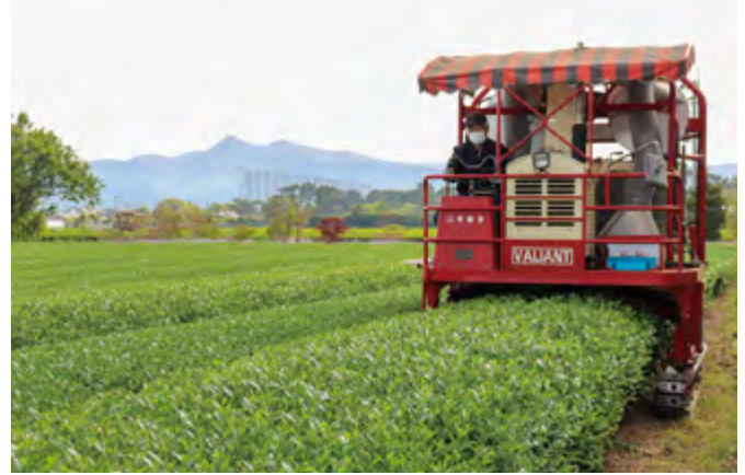
一番茶の摘み取り

この他にも、ソラマメや実えんどう、春バレイショ、紅甘夏などが出荷のピークを迎え、全国各地へと届けられました。